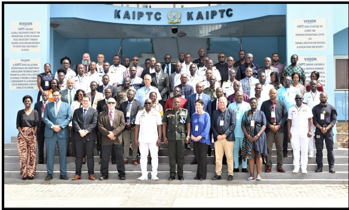
Deltagere inkluderede samarbejdspartnerne Kofi Annan International Peace Training Center (KAIPTC), Ghana, og Security Institute for Governance and Leadership in Africa (SIGLA) ved Stellenbosch University, Sydafrika.