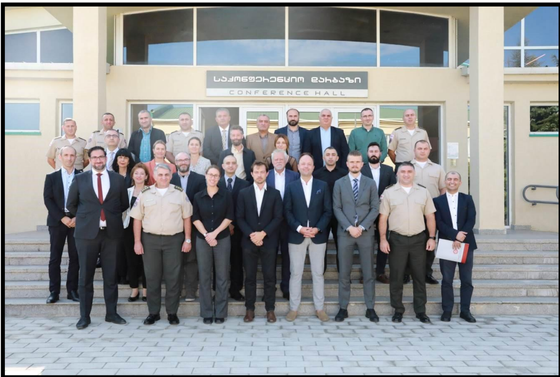
Deltagerne til FAK-NDA seminaret om de sikkerhedspolitiske udfordringer for Sydkaukasus og Sortehavsregionen i lyset af krigen i Ukraine, (Foto: NDA, Georgien)

I samarbejde med NDA afholdte CFS d. 27.-28. september et seminar i Gori, Georgien, under titlen "Examining Current Security Issues in light of the War in Ukraine: Lessons for the Future". Seminaret fokuserede på relevante sikkerhedsudfordringer i lyset af Ruslands krig i Ukraine, og hvordan disse har haft indvirkning på sikkerhedssituationen i Sydkaukasus i almindelighed og Georgien i særdeleshed. Blandt andet blev tiltagende multipolaritet, uddannelsen af officerer, den teknologiske udvikling inden for krigsførelse og ikke mindst de regionale sikkerhedsdilemmaer diskuteret. Både oplægsholdere fra FAK og NDA samt internationale fra blandt andet King's College og German Marshall Fund deltog i seminaret.