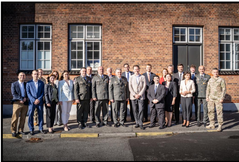
Academic Course på FAK inkluderede deltagere fra partnerinstitutionerne National Defence Academy (Gori, Georgien) og Defence Institution Building School (Tbilisi, Georgien)

CFS afholdte 3.-9. september et Academic Course i København for centrets to georgiske partnerinstitutioner, National Defence Academy (NDA) og Defence Institution Building School (DIBS). Som det første større arrangement afholdt med NDA og DIBS, havde kurset først og fremmest til formål at give en bred indføring i Forsvarsakademiets arbejde og rolle som militær undervisnings- og forskningsinstitution, for derigennem potentielt at inspirere fremtidige samarbejdsflader. Dernæst var formålet at dele perspektiver på en række sikkerhedspolitiske problemstillinger, særligt truslen fra Rusland, samt erfaring med militær forskning og undervisning. Flere oplægsholdere fra FAK deltog i kurset med oplæg om metodologi, akademisk skrivning, forskningsformidling og peer-review processer. Det omfang af relationsopbygning, som kurset faciliterede, skabte et stærkt fundament for det fremtidige samarbejde.