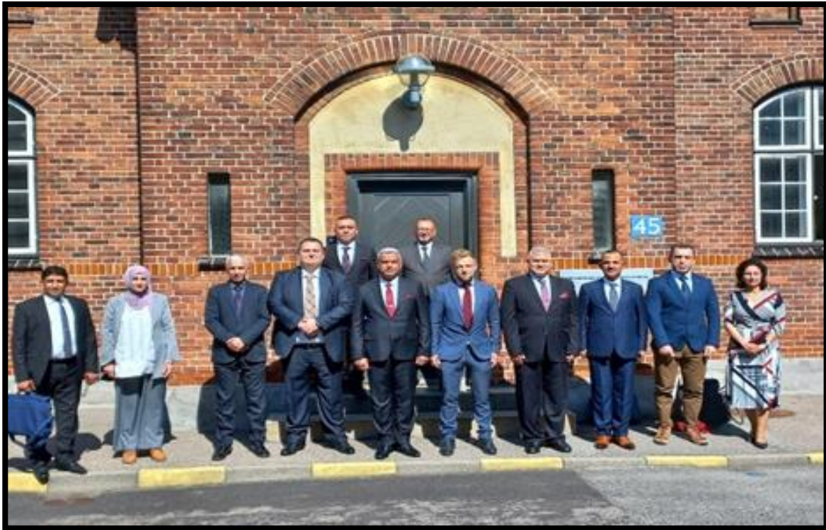
Delegation fra SSRC og FAK medarbejdere til Academic Research Course