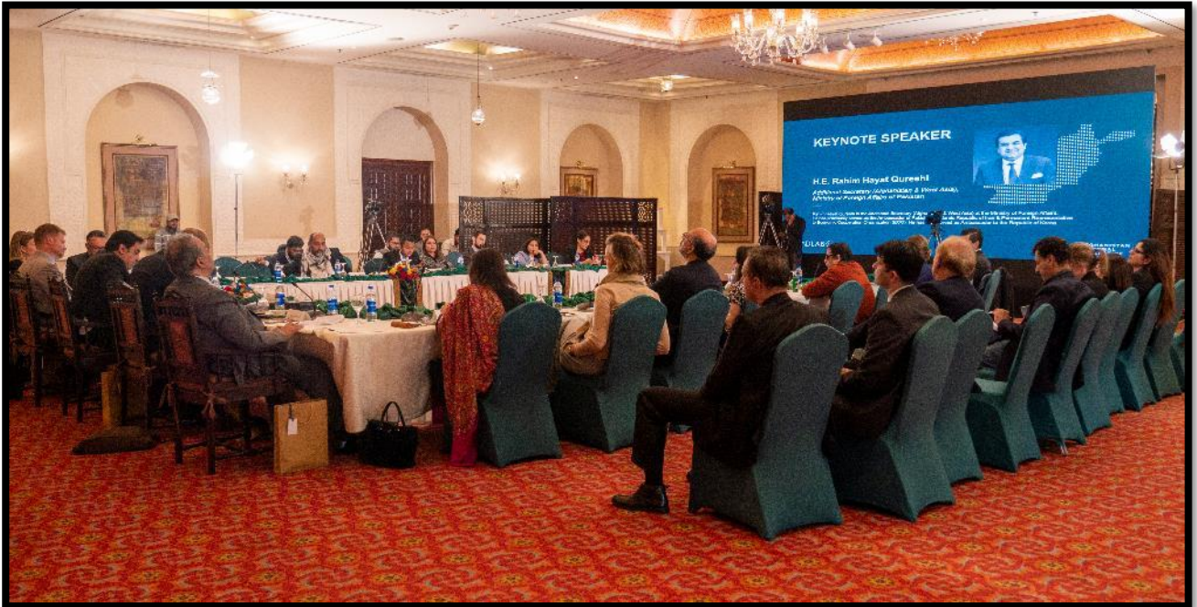
Fra konferencen Afghanistan Regional Collective (ARC) Dialogue II i november 2023