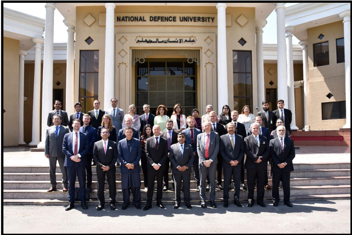
FAK delegation, deltagere fra NDU samt internationale eksperter til konference på NDU i Islamabad.