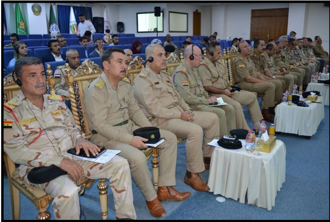
Irakiske deltagere til online-workshop om klimasikkerhed i Bagdad