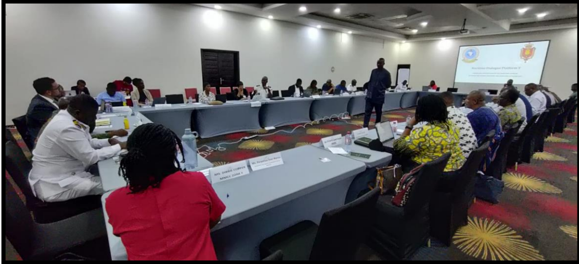
Deltagere til MDP V i Accra.

fiskeri. Effektivt politi- og lovgivningsarbejde, regionale lukkeperioder samt stærkere regionale overvågningsmekanismer gennem øget brug af nye tekniske værktøjer og strammere logbogskontrol blev nævnt som brugbare tiltag i bekæmpelsen af illegalt fiskeri. Seminaret havde blandt andet deltagelse af Ghanas viceminister for fiskeri.